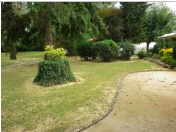
Vue de la laisse

Altitude calculée de l'eau (en m) : 199.21 m