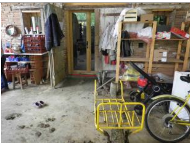
Vue de la laisse

Altitude calculée de l'eau (en m) : 203.67 m