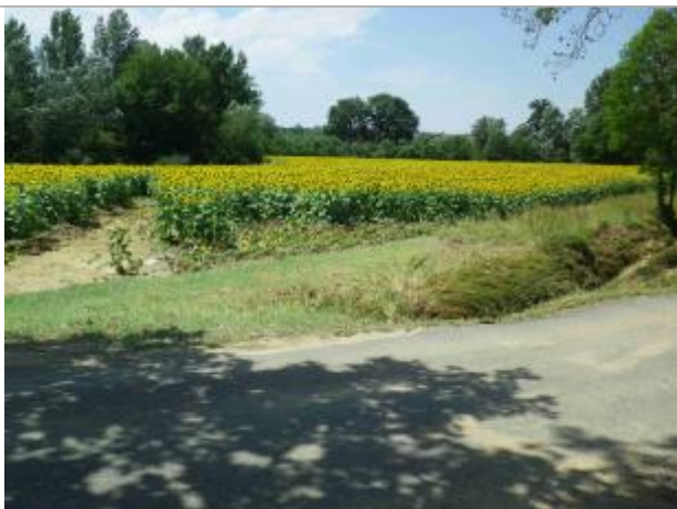
Vue de la laisse

Altitude calculée de l'eau (en m) : 210.92 m