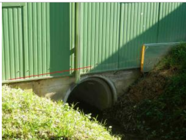
Vue de la laisse

Altitude calculée de l'eau (en m) : 204.94 m