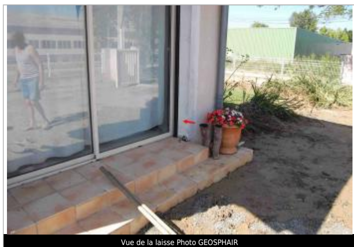
Vue de la laisse

Altitude calculée de l'eau (en m) : 198.41 m