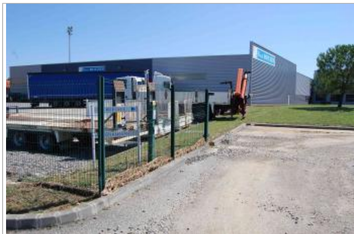
Vue du SITE Photo GEOSPHAIR

Coordonnées WGS84 : X: 1.33176207 / Y: 43.32973570