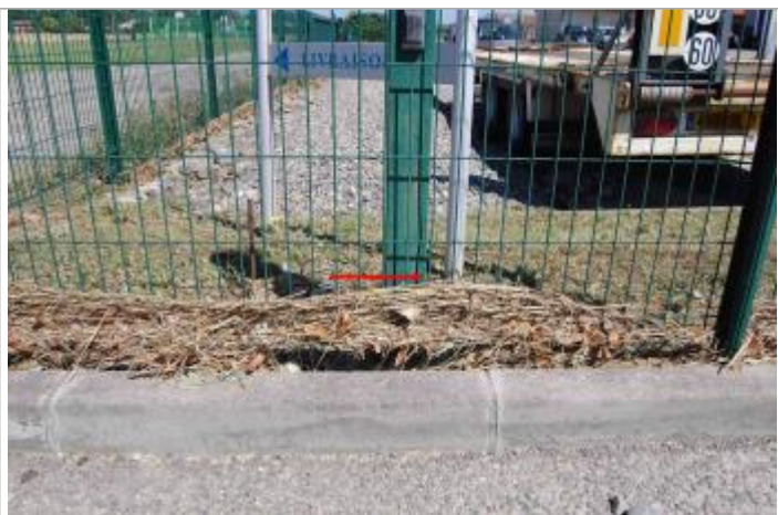
Vue de la laisse

Altitude calculée de l'eau (en m) : 195.81 m