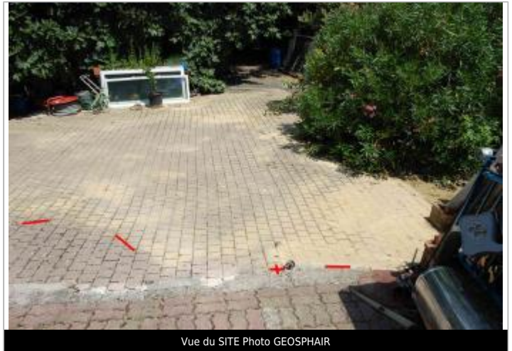
Vue du SITE Photo GEOSPHAIR

Coordonnées WGS84 : X: 1.35207050 / Y: 43.38197475