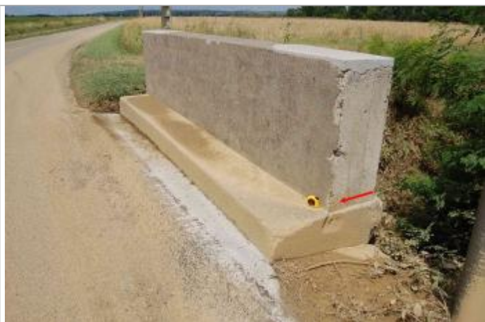
Vue de la laisse

Altitude calculée de l'eau (en m) : 173.85 m