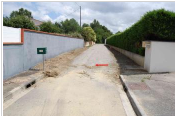
Vue du SITE Photo GEOSPHAIR

Coordonnées WGS84 : X: 1.39565298 / Y: 43.43725557