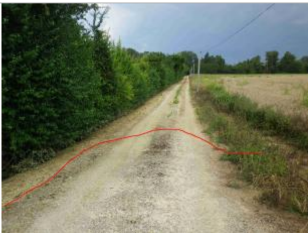
Vue de la laisse

Altitude calculée de l'eau (en m) : 199.22