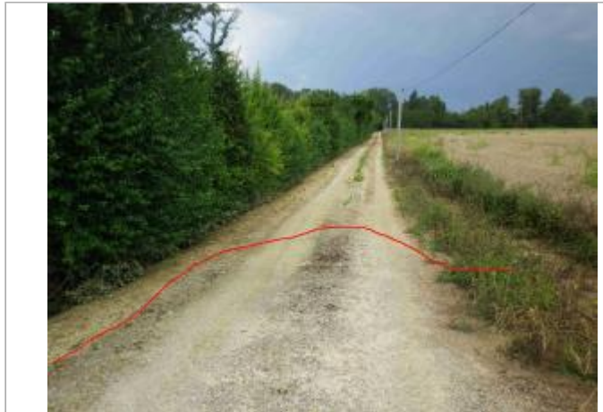
Vue du SITE Photo GEOSPHAIR

Coordonnées WGS84 : X: 1.33947066 / Y: 43.30887480