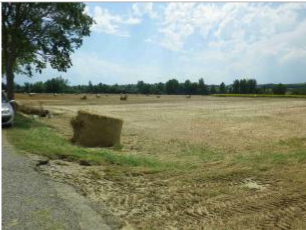
Vue de la laisse

Altitude calculée de l'eau (en m) : 205.91