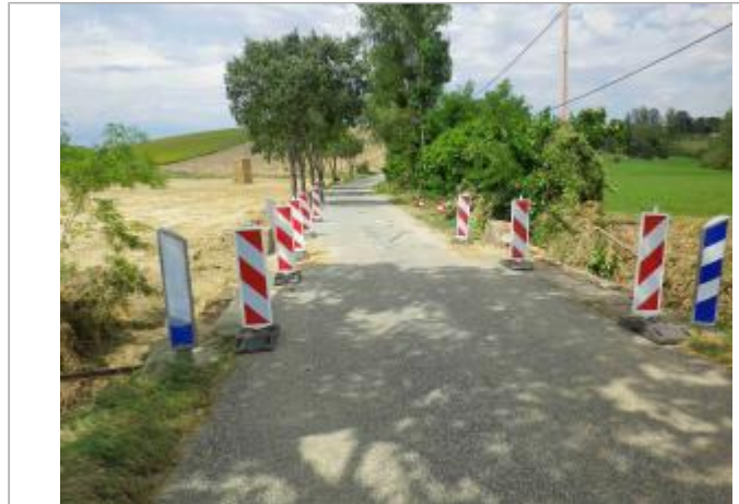
Vue du SITE Photo GEOSPHAIR

Coordonnées WGS84 : X: 1.34854267 / Y: 43.29798297