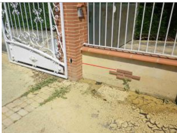
Vue de la laisse

Altitude calculée de l'eau (en m) : 206.45