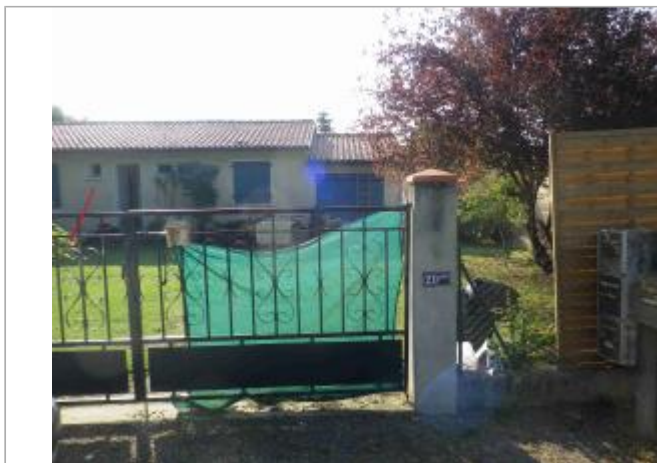
Vue du SITE Photo GEOSPHAIR

Coordonnées WGS84 : X: 1.34955950 / Y: 43.27834892