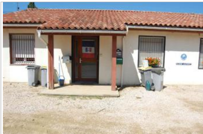
Vue du SITE Photo GEOSPHAIR

Coordonnées WGS84 : X: 1.32798172 / Y: 43.32646837