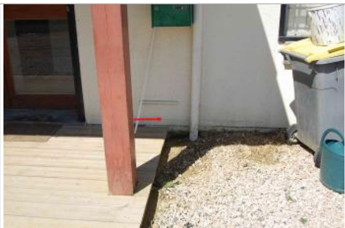
Vue de la laisse

Altitude calculée de l'eau (en m) : 196.28