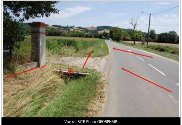
Vue du SITE Photo GEOSPHAIR

Coordonnées WGS84 : X: 1.34851977 / Y: 43.37635500