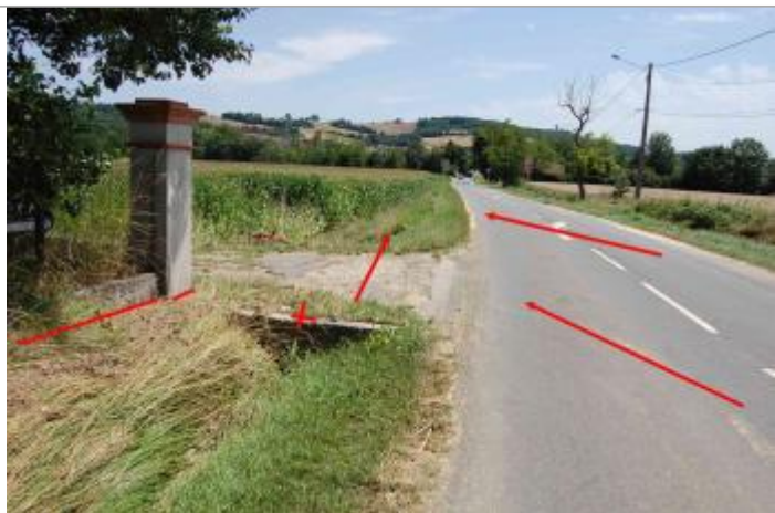
Vue de la laisse

Altitude calculée de l'eau (en m) : 184.88