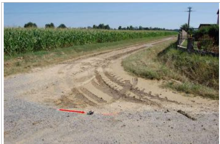
Vue de la laisse

Altitude calculée de l'eau (en m) : 173.43