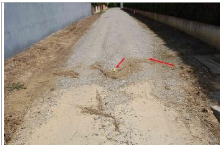
Vue de la laisse

Altitude calculée de l'eau (en m) : 167.98