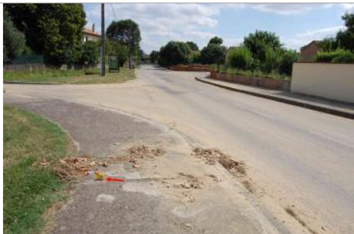
Vue de la laisse

Altitude calculée de l'eau (en m) : 165.42