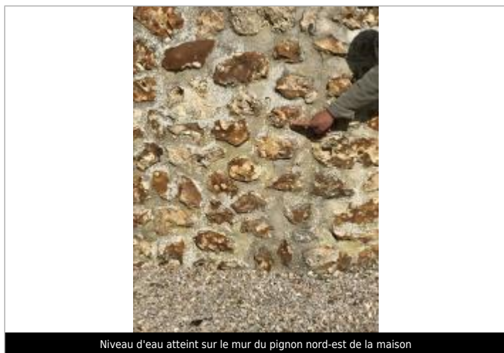
Niveau d'eau atteint sur le mur du pignon nord-est de la maison

Méthode : GPS Référence nivelée : Autre type de référence Description référence du repère : Niveau d'eau atteint sur le mur du pignon nord-est de la maison Système altimétrique : NGF IGN 1969 (système normal) Altitude de la référence (en m) : 128.420 m Altitude calculée de l'eau (en m) : 128.42 m