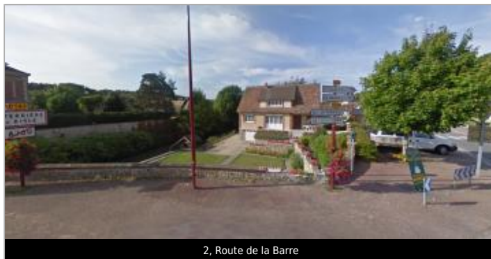
2, Route de la Barre