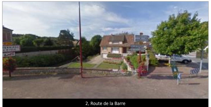
2, Route de la Barre

Coordonnées WGS84 : X: 0.78302230 / Y: 48.97885320