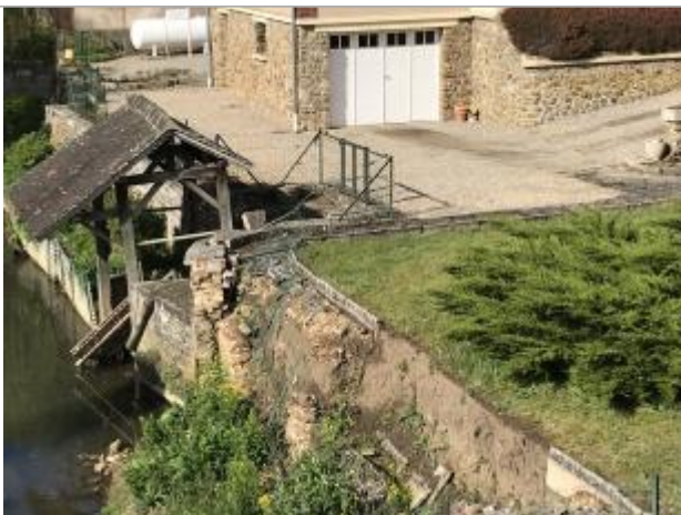
Traces au sol de la coulée de boue en provenance du chemin de la cavée

Altitude calculée de l'eau (en m) : 127.65