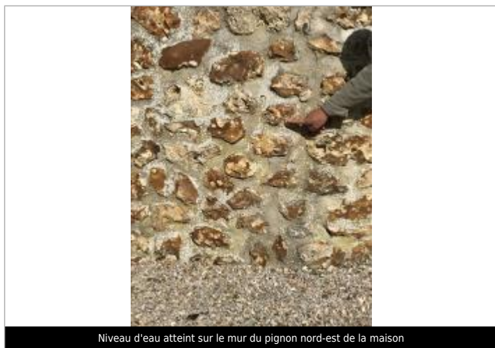
Niveau d'eau atteint sur le mur du pignon nord-est de la maison

Méthode : GPS Référence nivelée : Autre type de référence Description référence du repère : Niveau d'eau atteint sur le mur du pignon nord-est de la maison Système altimétrique : NGF IGN 1969 (système normal) Altitude de la référence (en m) : 128.420 m Altitude calculée de l'eau (en m) : 128.42