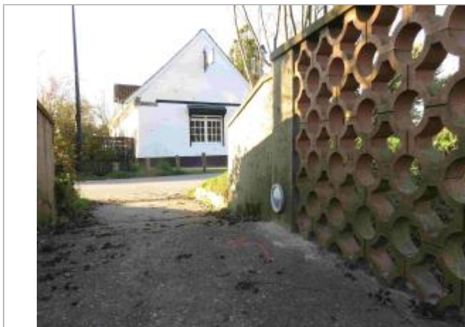
Passerelle de la Grenouillère