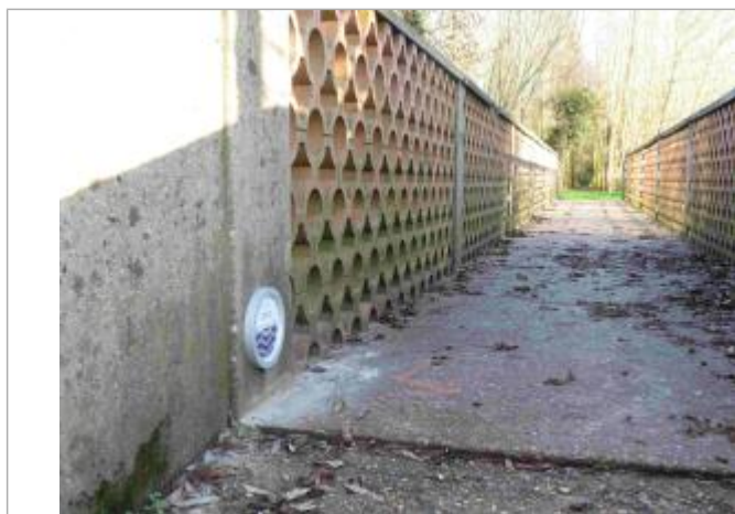
Repère posé sur la passerelle de la Grenouillère en rive gauche