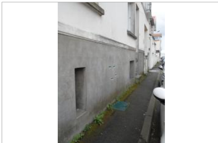
Quai Boissard (10)