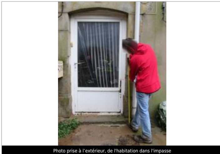
Photo prise à l'extérieur, de l'habitation dans l'impasse