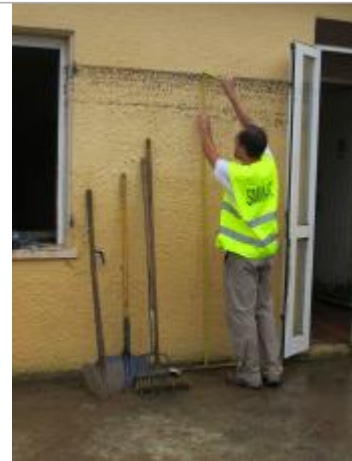
Photo prise sur le mur de la maison