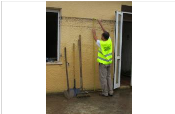
Photo prise sur le mur de la maison