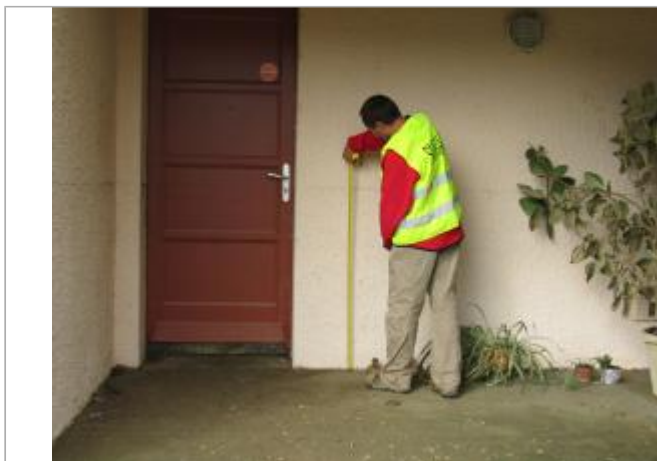
Photo prise à l'extérieur, sur la propriété privée