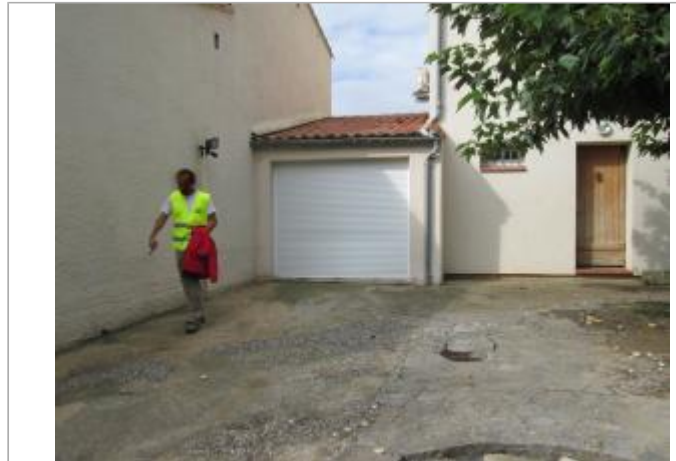
Photo prise à l'extérieur, sur la propriété privée

Coordonnées WGS84 : X: 2.35771670 / Y: 43.26543310