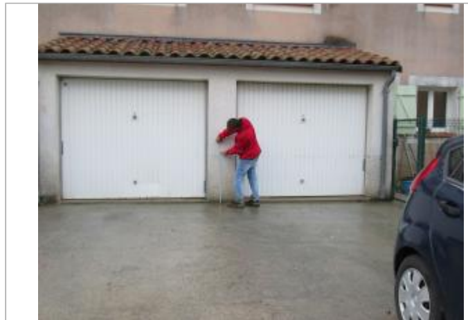
Photos prises à l'extérieur, dans la rue

Coordonnées WGS84 : X: 2.35779930 / Y: 43.27226090