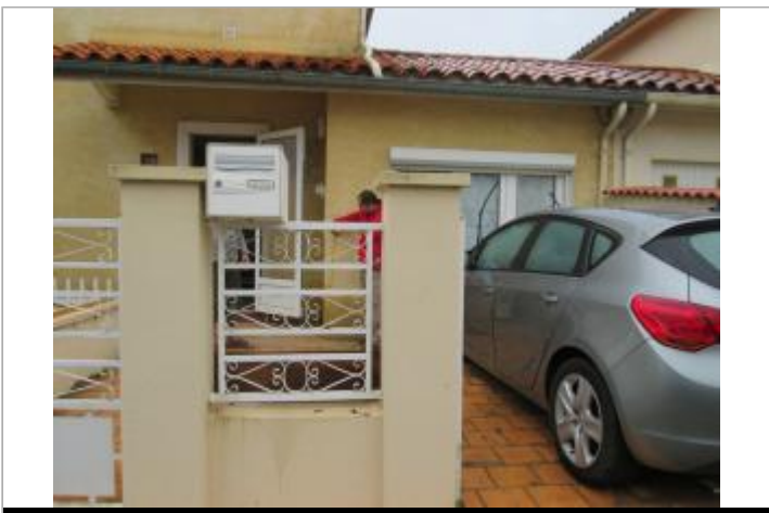
Photos prises à l'extérieur, sur la propriété privée

GÉOLOCALISATION Coordonnées WGS84 : X: 2.35553550 / Y: 43.26480350 Coordonnées RGF93 (Lambert 93) X: 647643.66 / Y: 6240838.13 Coordonnées RGF93 (ETRS89) : X: 2.3555355 / Y: 43.2648035 Code Hydro: Y1400500 Rive de référence: Droite