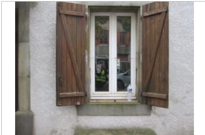
Photo prise à l'extérieur, de l'habitation, dans la rue