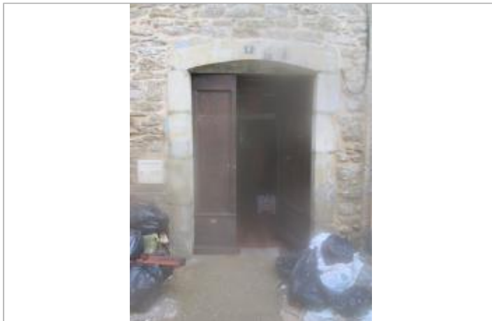
Photo prise à l'extérieur, de l'habitation, dans la rue