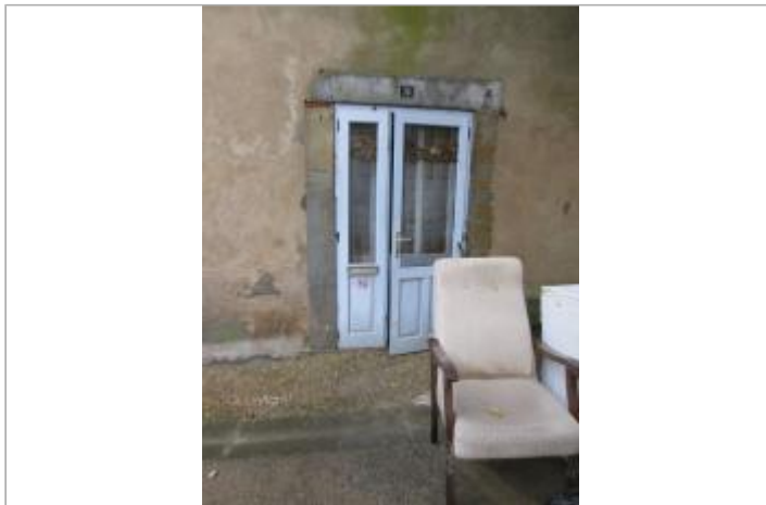
Photo prise à l'extérieur, de l'habitation, dans la rue