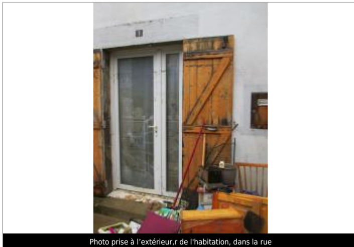
Photo prise à l'extérieur, r de l'habitation, dans la rue