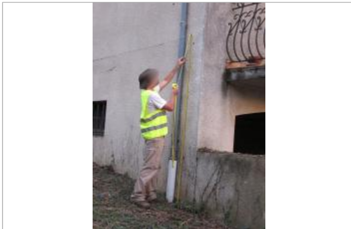
Photo prise sur le mur de la maison depuis le jardin