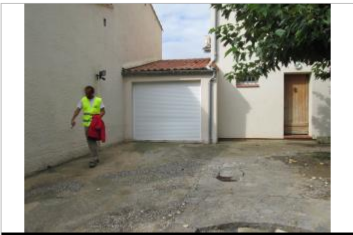
Photo prise à l'extérieur, sur la propriété privée

GÉOLOCALISATION Coordonnées WGS84 : X: 2.35771670 / Y: 43.26543310 Coordonnées RGF93 (Lambert 93) X: 647821.43 / Y: 6240906.68 Coordonnées RGF93 (ETRS89) : X: 2.3577167 / Y: 43.2654331 Code Hydro: Y1400500 Rive de référence: Droite