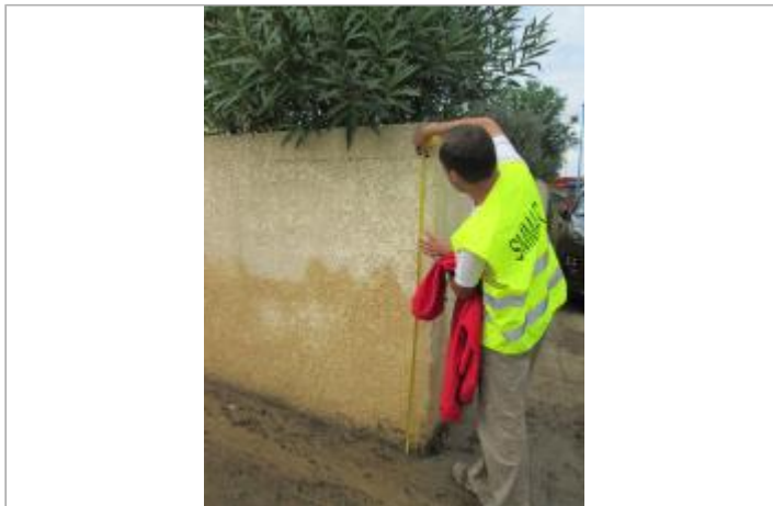
Photo prise à l'extérieur, sur la propriété privée