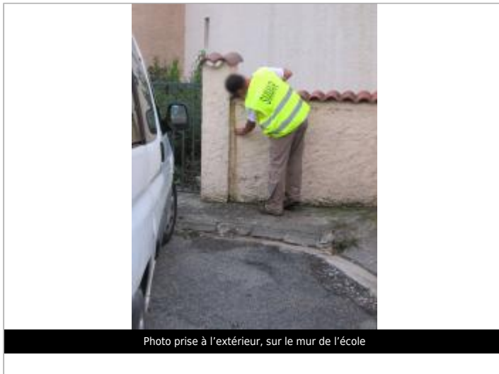
Photo prise à l'extérieur, sur le mur de l'école