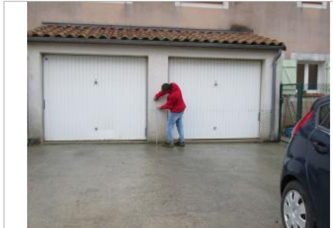
Photos prises à l'extérieur, dans la rue

Coordonnées WGS84 : X: 2.35779930 / Y: 43.27226090