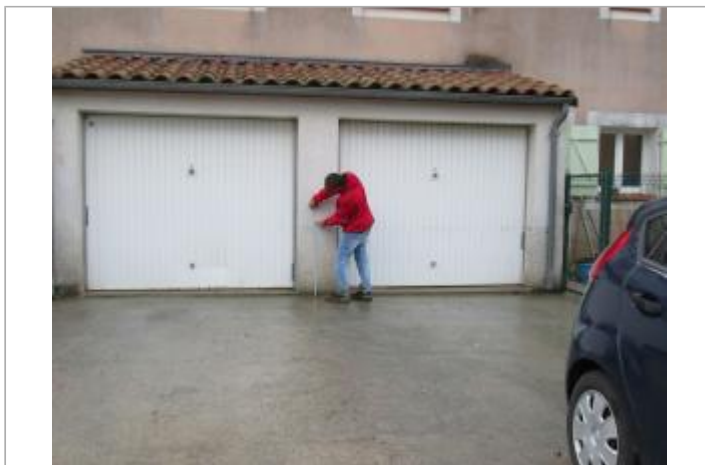
Photos prises à l'extérieur, dans la rue