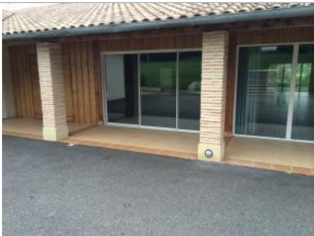
Au pied du bâtiment Espace Arlabosse à Roquefort

Altitude calculée de l'eau (en m) : 63.52 m