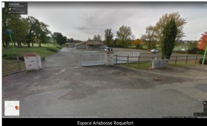
Espace Arlabosse Roquefort