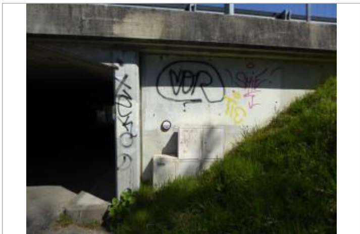
Repère de crue sur la culée du pont de l'A62 sur la rue des Fleurs à Roquefort

MARQUE Texte : 10 juin 2008 - Ruisseau Labourdasse Maximum de l'inondation : Oui Visibilité : Oui