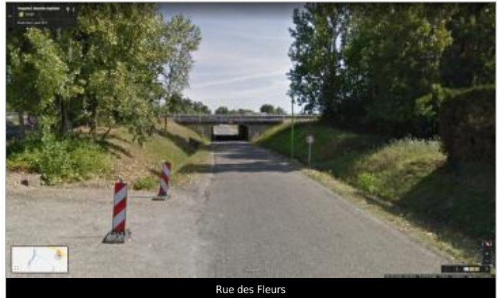
Rue des Fleurs

GÉOLOCALISATION Coordonnées WGS84 : X: 0.56326586 / Y: 44.18135330 Coordonnées RGF93 (Lambert 93) X: 505211.55 / Y: 6345488.46 Coordonnées RGF93 (ETRS89) : X: 0.5632659 / Y: 44.1813533