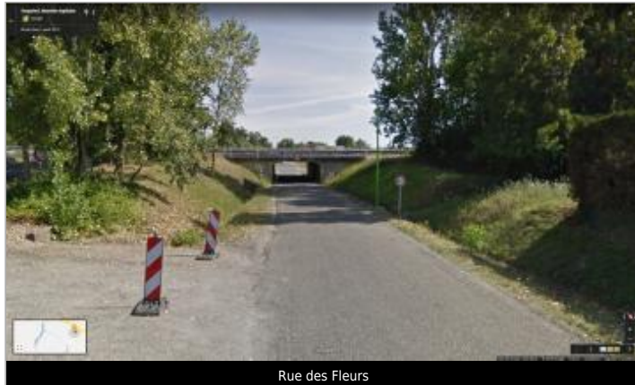
Rue des Fleurs