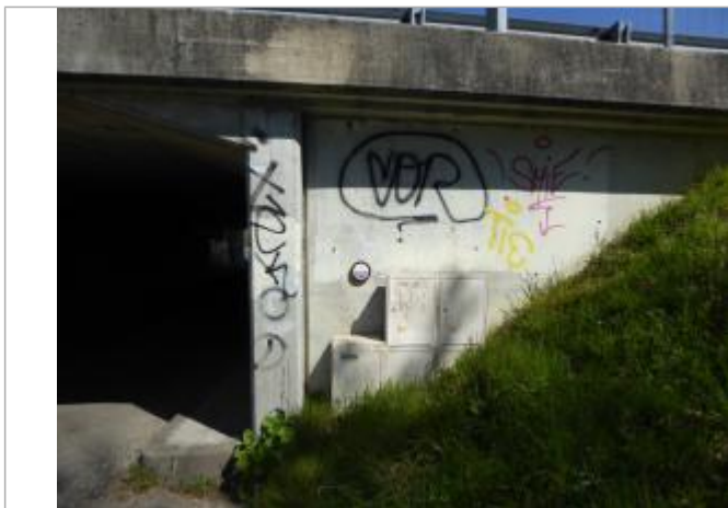
Repère de crue sur la culée du pont de l'A62 sur la rue des Fleurs à Roquefort