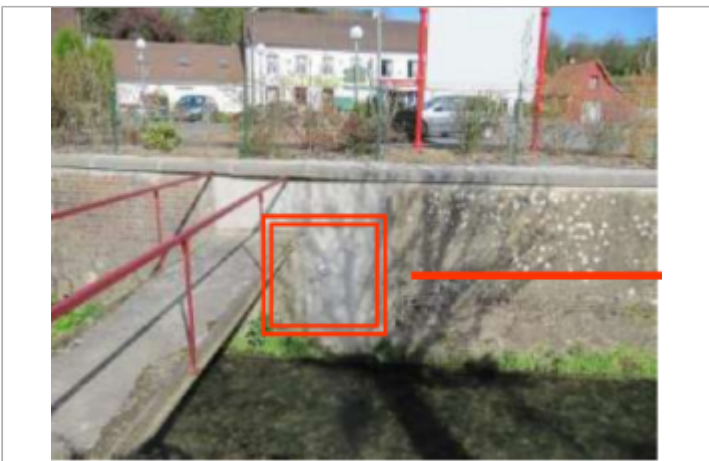
Pont à proximité du croisement avec la rue Drionville

GÉOLOCALISATION Coordonnées WGS84 : X: 2.03098800 / Y: 50.67383700 Coordonnées RGF93 (Lambert 93) X: 631383.89 / Y: 7064530.16 Coordonnées RGF93 (ETRS89) : X: 2.030988 / Y: 50.673837 Code Hydro: E4030650 Rive de référence: Gauche