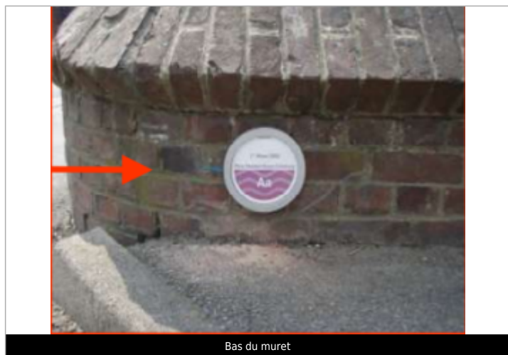
Bas du muret

Visibilité : Oui État du repère : Bon Pérennité : Longue