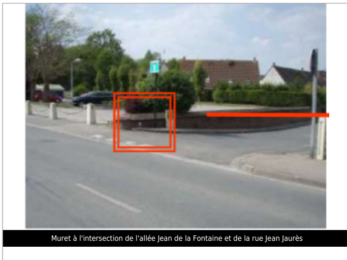
Muret à l'intersection de l'allée Jean de la Fontaine et de la rue Jean Jaurès