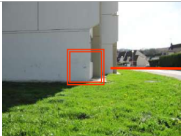
Bâtiment E5 résidence des Chauffours