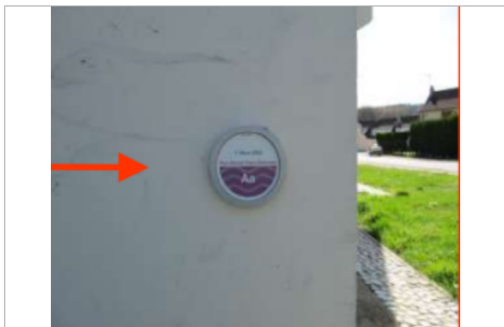
Residence des Chauffours (Bâtiment E5)