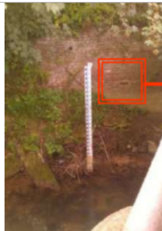
Amont du pont rue Pierre Mendès France