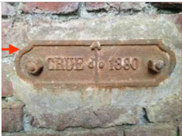
Repère derrière l'échelle limnimétrique