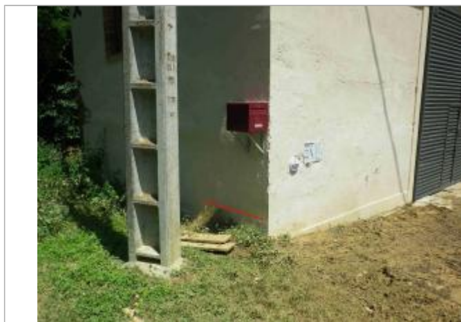
Vue de la laisse d'inondation

Altitude calculée de l'eau (en m) : 206.61 m