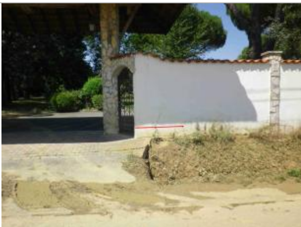
Vue de la laisse d'inondation

Altitude calculée de l'eau (en m) : 206.14 m