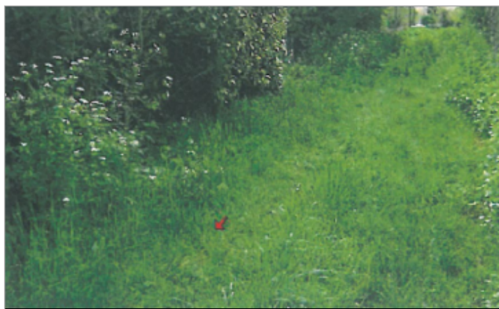
Photographie du repère