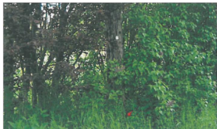
Photographie du repère