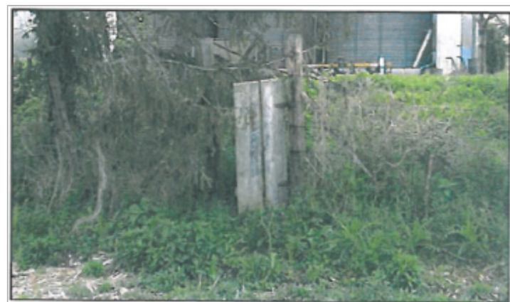
Photographie du repère

GÉNÉRAL Code : WEB_R_201903251446 Date de mise à jour : 25/03/2019 Auteur : SPC LCI