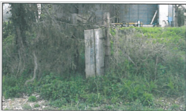
Photographie du repère