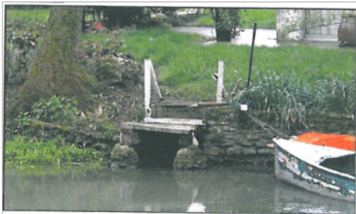
Photographie du repère